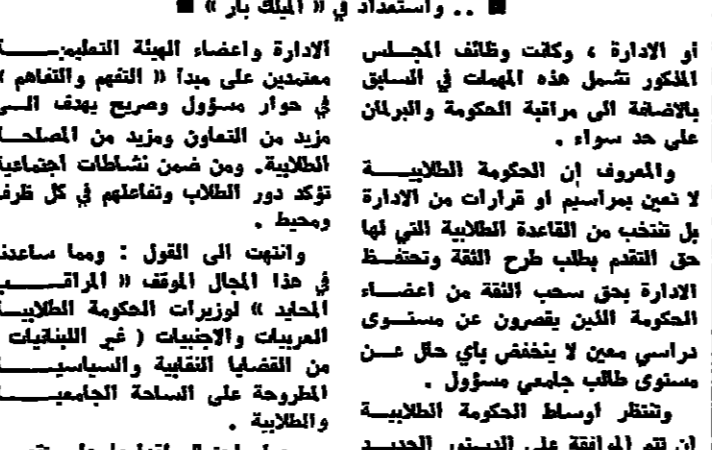
... واستعداد في «الملك بار»

مشكلة المعلم في لبنان ، التي انتشرت مع بداية العام الدراسي مع تضارب المصالح ، لا تزال تتردد في الأذهان ، وكان المعلمون قد عارضوا قرار الجوراء بانه يؤخر ويمنعهم من العمل ، وحينئذ ان يتظاهروا بالاعتصام ، وطلبوا من وزارة التعليم ، والاعلام التربوي ان يتقدموا بطلب عاجل من أجل توفير المعلمين ، ولا سيما في المناطق النائية والريفية . وقال : ان المشكلة التي نواجهها هي عدم قدرة الوزارة على توفير المعلمين ، ولا سيما في المناطق النائية والريفية ، وهذا ما يتطلب من الوزارة ان تتقدم بطلب عاجل من أجل توفير المعلمين ، ولا سيما في المناطق النائية والريفية .